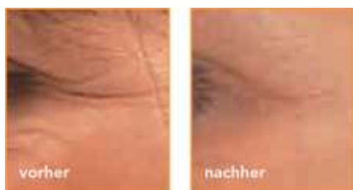
Periorbitale Linien 2

Belotero® Basic wurde im Rahmen einer multizentrischen klinischen Studie* mit 114 Patienten im Alter von 30 bis 60 Jahren mit hervorragenden Ergebnissen getestet. Sowohl die lang anhaltende Wirkung als auch die sehr gute Verträglichkeit haben Ärzte und Patienten gleichermaßen überzeugt.