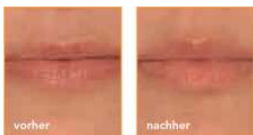
Volumenauffüllung der Lippe

Belotero® Basic wurde im Rahmen einer multizentrischen klinischen Studie* mit 114 Patienten im Alter von 30 bis 60 Jahren mit hervorragenden Ergebnissen getestet. Sowohl die lang anhaltende Wirkung als auch die sehr gute Verträglichkeit haben Ärzte und Patienten gleichermaßen überzeugt.